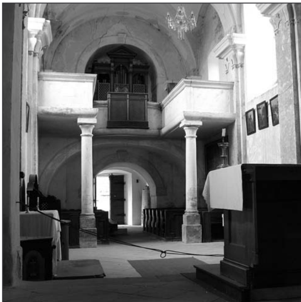
Obr. 2: Plaňany (okr. Kolín), kostel Zvěstování Panny Marie. Pohled do západní části chrámu (foto autor 2008).

možné předpokládat dosažení korunní římsy apsidy, o níž nejsou prozatím k dispozici žádná měřitelná data). Čtvrtá stavební fáze dosáhla nivelity 8,5 metru a v této etapě byla konstruována ostění románských oken. Pátá stavební fáze byla pro loď závěrečná. Bylo vyvedeno obloučkové podřímsí, ozuby a ve výšce necelých 10 metrů byla loď zastropena. Je nutné poukázat na fakt, že pátá etapa výstavby byla na severní i jižní stěně zhruba poloviční nežli předchozí. Zdánlivá nelogičnost výstavby je pravděpodobně vysvětlitelná tím, že v této periodě bylo třeba loď nejen zastropit, ale i zastřešit, tudíž bylo nutné vyzdít štíty a zřejmě zhotovit i krov.