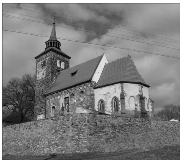
Obr. 1: Plaňany (okr. Kolín), kostel Zvěstování Panny Marie. Celkový pohled na kostel od jihovýchodu (foto autor 2009).

Plaňanský kostel díky svému dobře čitelnému líci zdiva na plášti lodi i věže umožňující detailní nahlédnutí na objekt v procesu jeho vzniku, může rozšířit srovnávací materiál v této problematice. Struktura románského zdiva a velikost použitých kamenných kvádrů v jednotlivých částech zdí jasně definují několik konstrukčních fází výstavby.